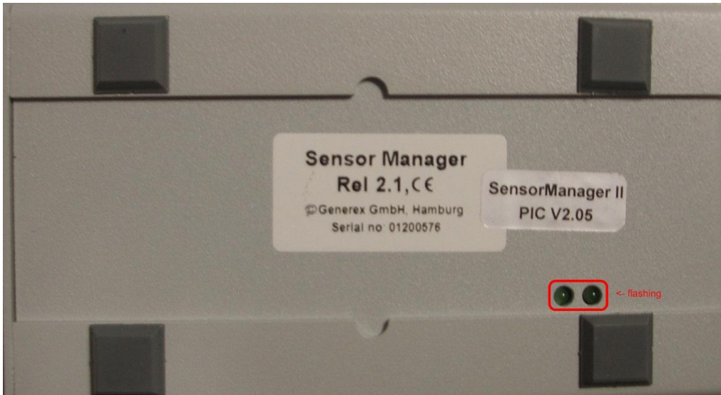
Abbildung: SENSORMANAGER LEDs

Verbinden Sie die Sensoren mit dem SENSORMANAGER. Schließen Sie den SENSORMANAGER mit Hilfe des Mini8-DBSub9 Kabel an den COM2 Port der SNMP-Karte Professional an. Stecken Sie die Stromversorgung in eine der USV Ausgänge. Kontrollieren Sie die LEDs auf der Unterseite des SENSORMANAGERS II: die rechte LED sollte blinken (reading request from SNMP-Karte Professional COM2), die linke sollte konstant leuchten (Power Supply on). Die blinkende LED zeigt die Anfragen des SNMP-Karte Professional an, die andere die Betriebsbereitschaft.